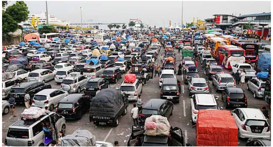
Antrean kendaraan roda empat memadati area Pelabuhan Merak, Cilegon, Banten saat arus mudik Lebaran 2023.

Fahira menekankan pentingnya skema 4K—kesiapan dan kesediaan infrastruktur jalan, manajemen lalu lintas, regulasi, serta koordinasi dan kolaborasi—untuk menjamin kelancaran arus mudik. Pemerintah, menurut Fahira, telah mengambil langkah-langkah penting, termasuk rapat koordinasi antara Korlantas Polri, Ke-