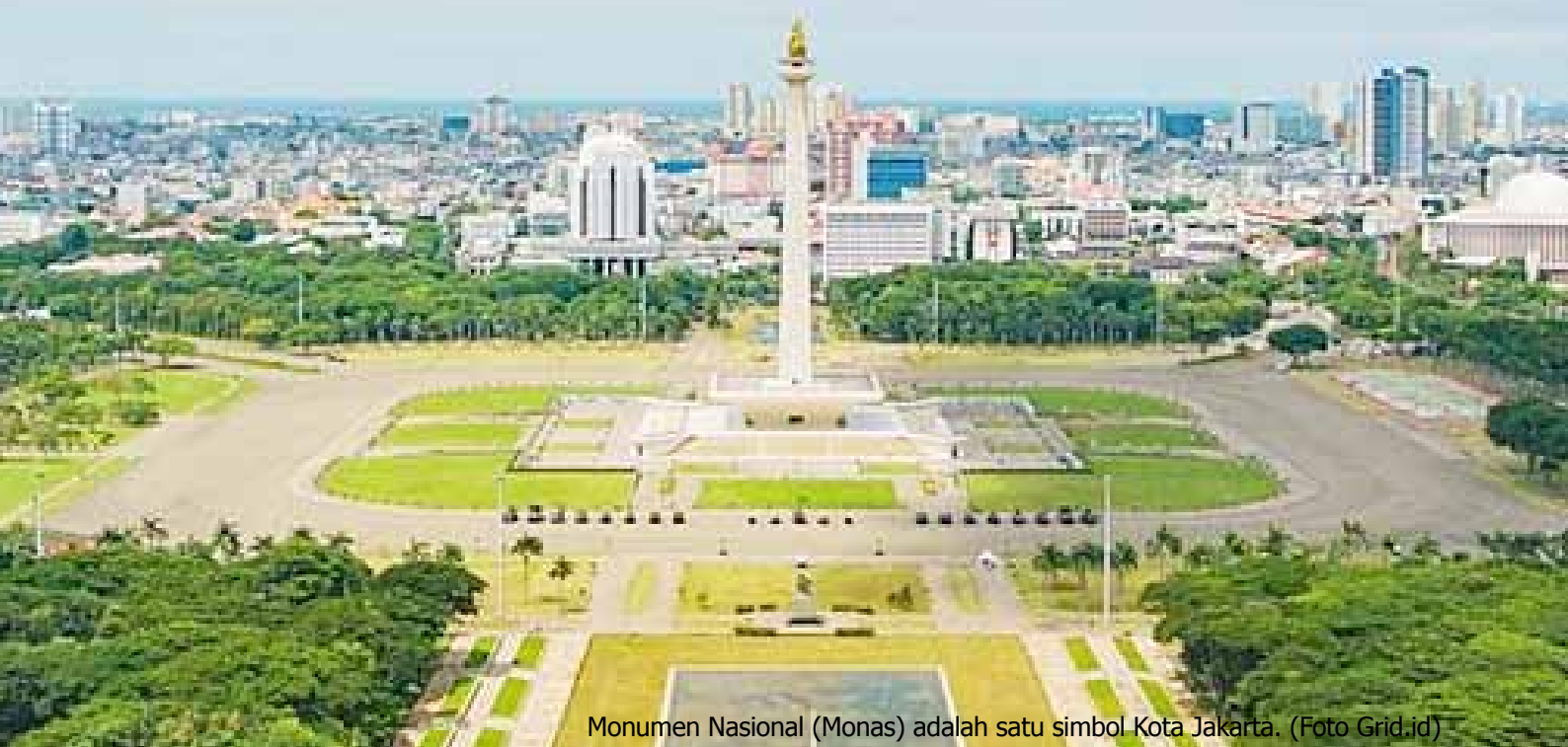
Monumen Nasional (Monas) adalah satu simbol Kota Jakarta.