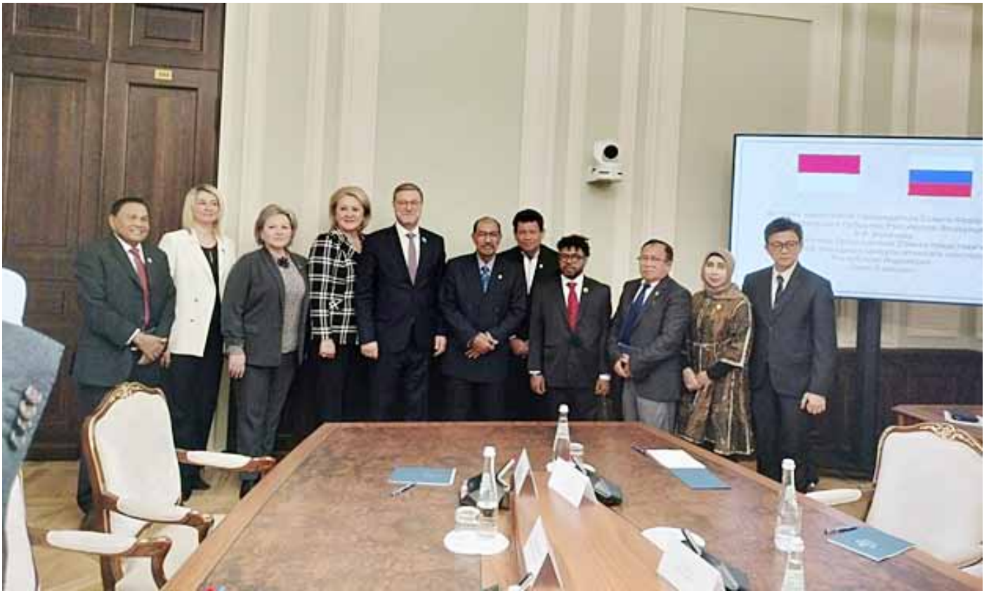
Wakil Ketua Majelis Federal Rusia Konstantin Kosachev bersama delegasi DPD RI.

Nono Sampono menyatakan, “Kita bersepakat bahwa kerja sama antarpemerintah dapat meningkatkan hubungan bilateral RI-Rusia. Kami berharap kerja sama ini akan terus bertambah, memperdalam hubungan baik antara kedua negara.” Dia menekankan bahwa perdagangan antara Indonesia dan Rusia telah berkembang pesat, mencatat peningkatan hampir 70% pada tahun 2022, dengan harapan mencapai target 5 miliar USD pada tahun 2024.