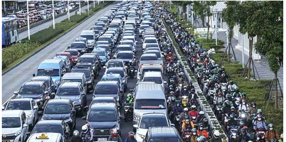
Ilustrasi kemacetan lalu lintas yang terjadi di ruas Jalan Sudirman Jakarta.

“Dengan populasi yang mencapai lebih dari 30 juta jiwa, wilayah Jabodetabek telah menjadi salah satu aglomerasi terbesar di dunia. Ini menimbulkan ketergantungan yang signifikan pada pergerakan antarwilayah, dengan estimasi pergerakan harian mencapai jutaan trip,”