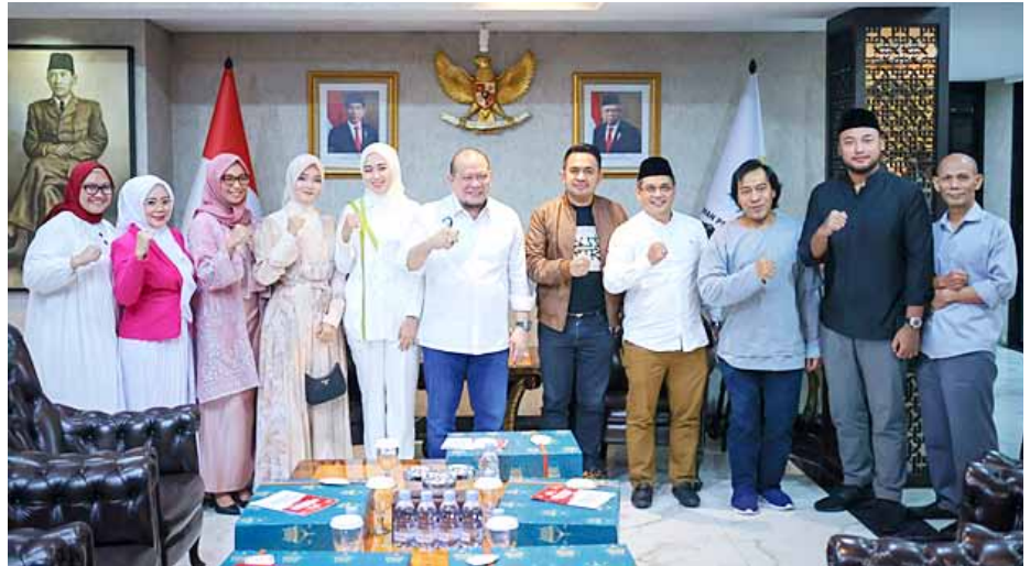
Ketua DPD RI AA LaNyalla Mahmud Mattalitti bersama calon senator terpilih Alfiansyah Komeng Bustami (Jabar), Aanya Rina Casmayanti (Jabar), Agita Nurfianti (Jabar), Cerint Iralloza Tasya (Sumbar), Imral Adenansi (Sumbar), M Rifki Farabi (NTB), Mirah Midadan (NTB), Laode Umar Bonte (Sultra) dan Achmad Azran (DKI Jakarta).

LaNyalla mengungkapkan bahwa lima proposal kenegaraan DPD RI bermula dari pengamatan ketidakadilan dan kemiskinan struktural, yang dianggap berasal dari perubahan konstitusi pada tahun 1999-2002 yang mengesampingkan Pancasila. “Salah satu usulan krusial adalah memberikan kesempatan kepada individu non-partisan untuk menjadi