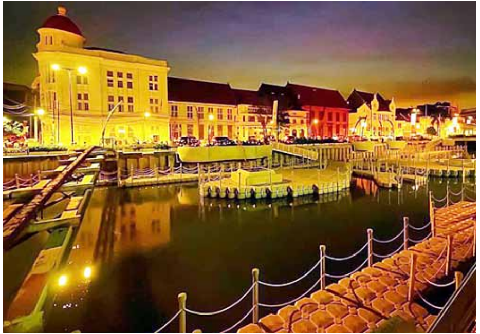
Kawasan Kota Tua Jakarta yang indah memesona.

Nama Jakarta sendiri telah mengalami beberapa kali perubahan. Dikenal sebagai Sunda Kalapa di era Kerajaan Sunda, nama tersebut berubah menjadi Jayakarta, Djajakarta, atau Jacatra di masa Kesultanan Banten. Sejarah Jakarta dapat dibagi menjadi tiga era penting: Kota Tua Jakarta, yang berkembang antara 1619 dan 1799 di era VOC, dikenal dengan kehidupan per-