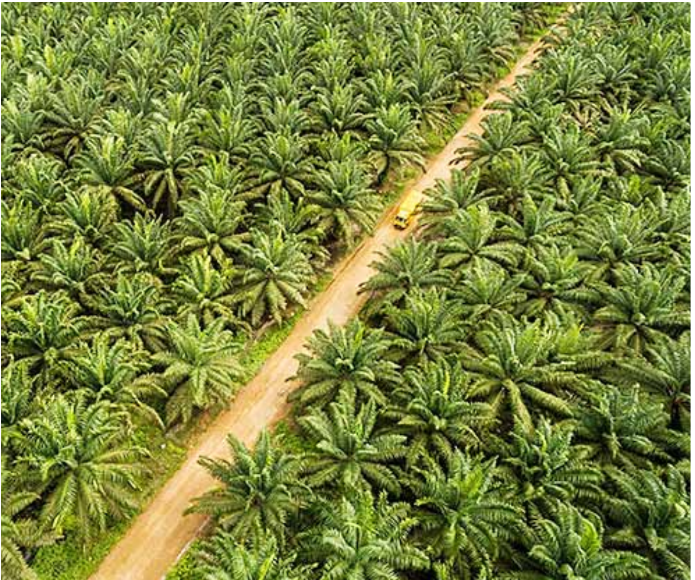
Ilustrasi hamparan perkebunan kelapa sawit di Indonesia.

Sebagai produsen sawit terbesar di dunia, Sultan berpendapat bahwa masyarakat Indonesia seharusnya dapat menikmati harga minyak goreng yang stabil, sesuai dengan hasil produksi sawit. Usulan kebijakan ini diharapkan dapat memberikan kepastian harga bagi petani sawit mandiri di daerah.