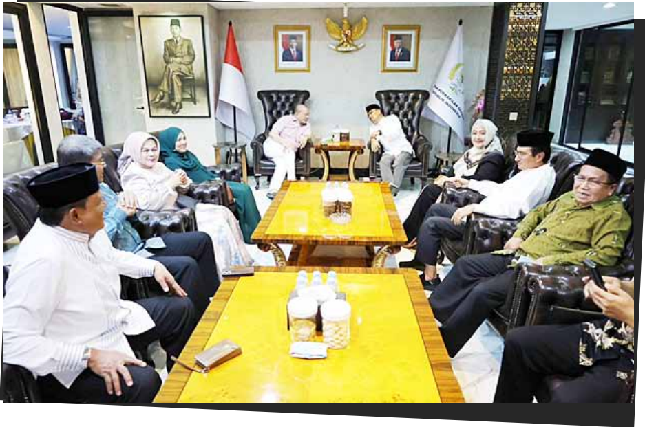
Ketua DPD RI AA LaNyalla Mahmud Mattalitti didampingi Wakil Ketua DPD RI Nono Sampono bersama sejumlah anggota DPD RI dalam kegiatan berbuka puasa bersama di kediaman Ketua DPD RI, di Jakarta, Sabtu (30/3/2024).