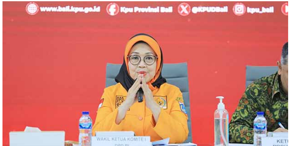
Wakil Ketua Komite I DPD RI Sylviana Murni.

Dalam rangka mempersiapkan pelaksanaan Pemilihan Kepala Daerah (Pilkada) Serentak 2024, Komite I Dewan Perwakilan Daerah (DPD) RI melakukan kunjungan kerja ke Provinsi Bali pada Selasa (10/9/2024).