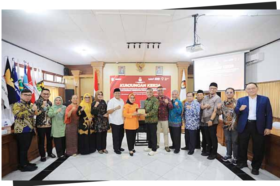
Dalam rangka mempersiapkan pelaksanaan Pemilihan Kepala Daerah (Pilkada) Serentak 2024, Komite I Dewan Perwakilan Daerah (DPD) RI melakukan kunjungan kerja ke Provinsi Bali pada Selasa (10/9/2024).