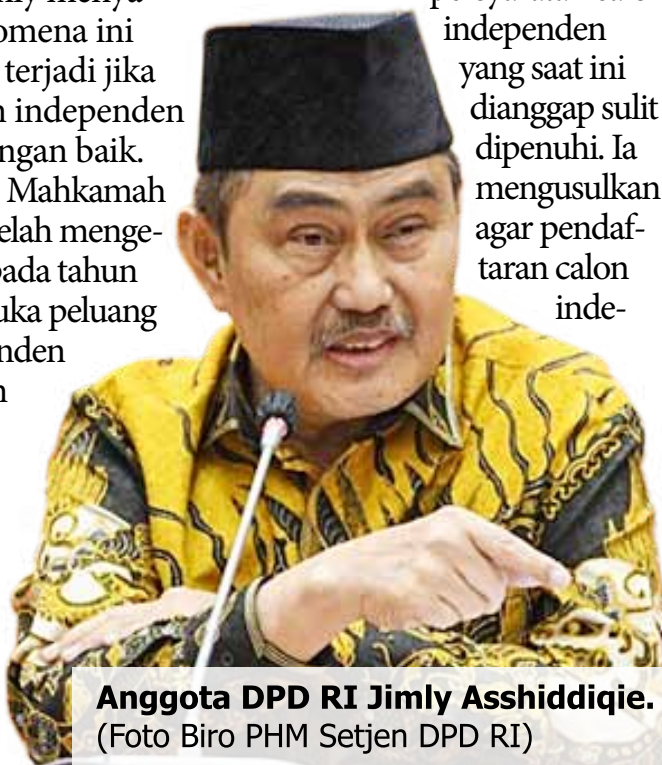
Anggota DPD RI Jimly Asshiddiqie.

Jimly berharap evaluasi ini dapat mencegah terulangnya calon tunggal melawan kotak kosong pada pilkada mendatang, sehingga proses demokrasi berjalan lebih adil dan kompetitif.(*)