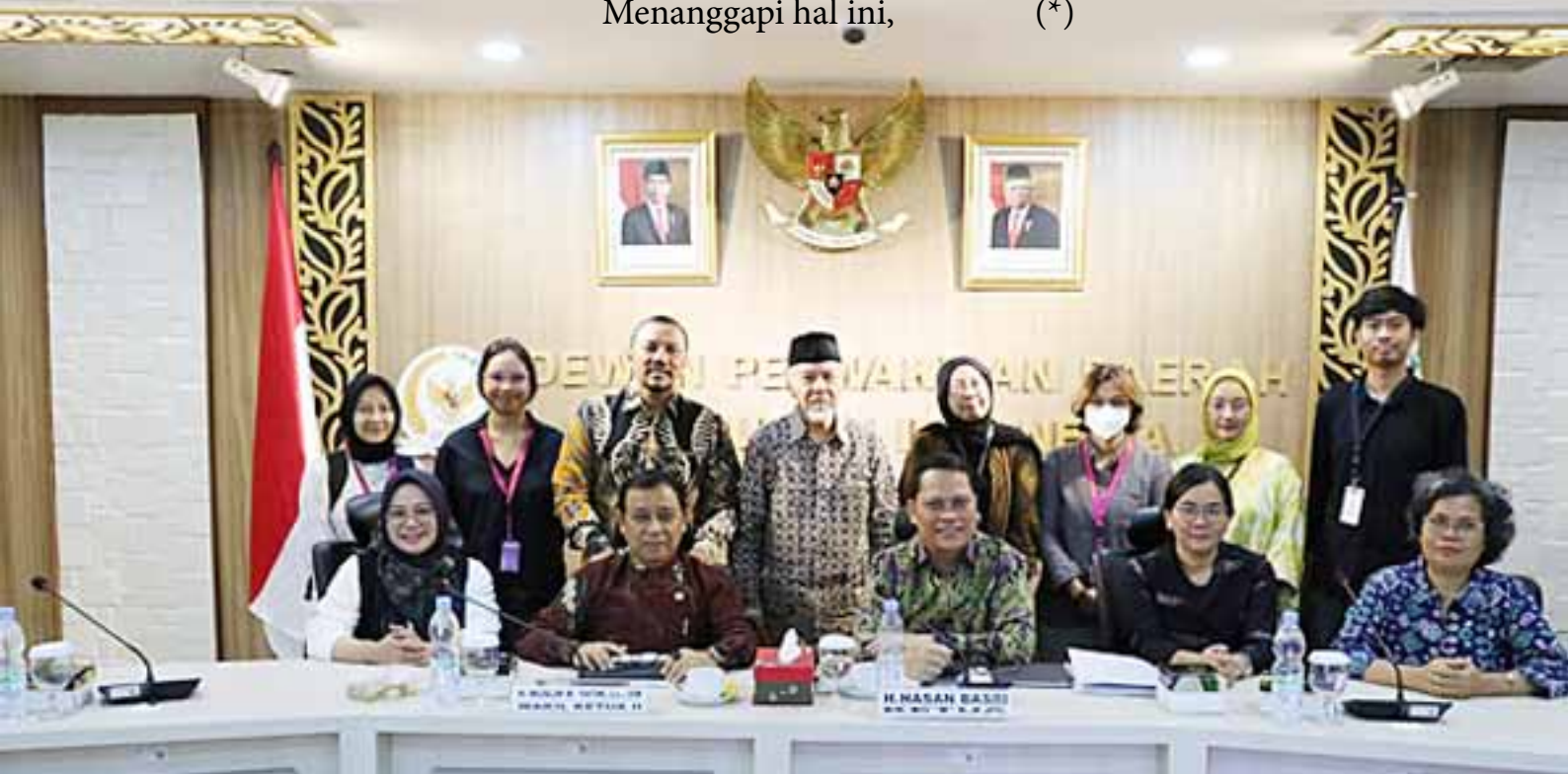
Foto bersama Pimpinan Komite IV DPD RI dengan Komisi Nasional (Komnas) Anti Kekerasan Terhadap Perempuan dan Lembaga Bantuan Hukum Asosiasi Perempuan Indonesia untuk Keadilan (LBH APIK).