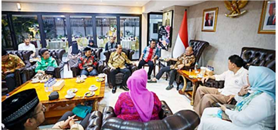
Ketua DPD RI AA LaNyalla Mahmud Mattalitti saat menerima Majelis Adat Kerajaan Nusantara (MAKN) di kediaman Ketua DPD RI, kawasan Kuningan, Jakarta Selatan, Minggu (1/9/2024).

Terpilih atau tidak sebagai Ketua DPD RI periode 2024-2029, AA LaNyalla Mahmud Mattalitti akan tetap komit memperjuangkan eksistensi kerajaan dan kesultanan nusantara di masa mendatang.