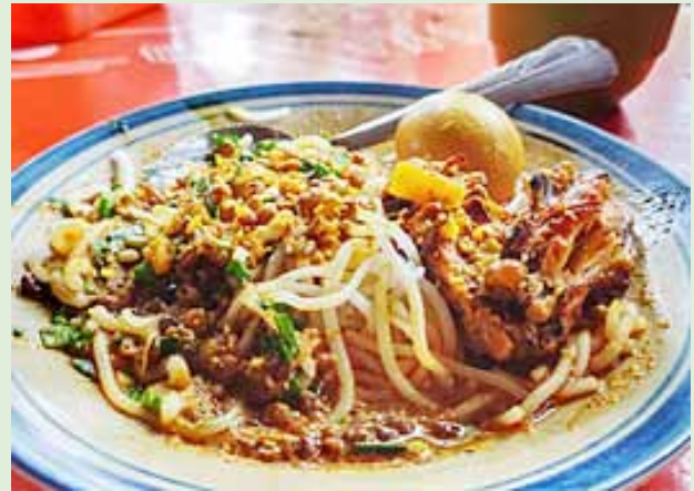
(Ilustrasi satu impresi)

Laksa Tangerang adalah salah satu kuliner khas yang paling dicari oleh para pecinta makanan di kota ini. Hidangan berkuah santan yang gurih ini memiliki rasa yang kaya, terbuat dari rempah-rempah khas seperti serai, lengkuas, dan daun jeruk. Kuahnya yang kental disajikan dengan ketupat atau lontong, serta pelengkap seperti tauge, telur, dan potongan ayam atau udang. Kelezatan Laksa Tangerang tidak hanya dikenal oleh masyarakat lokal, tetapi juga menjadi daya tarik bagi wisatawan yang berkunjung.