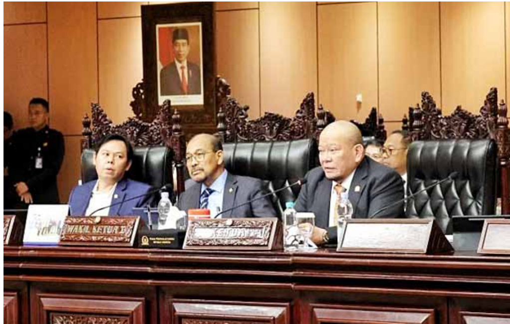
Ketua DPD RI AA LaNyalla Mahmud Mattalitti didampingi Wakil Ketua DPD RI Nono Sampono dan Sultan B Najamudin saat memimpin sidang paripurna tanggal 12 Juli 2024.

Dewan Perwakilan Daerah (DPD) RI, melalui Komite I, resmi mengawasi dan mengawal tahapan pelaksanaan Pilkada Serentak 2024 yang akan digelar pada 27 November mendatang. Pilkada ini akan dilaksanakan di 37 provinsi untuk pemilihan gubernur dan wakil gubernur, serta di 508 kabupaten/kota untuk pemilihan bupati, wakil bupati, wali kota, dan wakil wali kota.