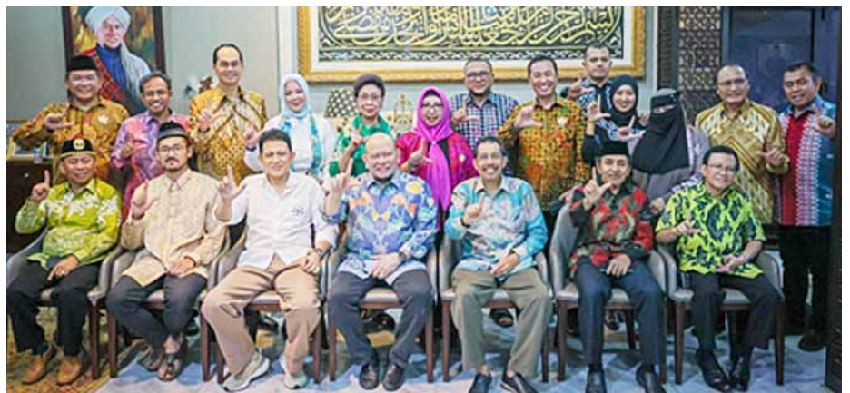
Foto bersama Ketua DPD RI AA LaNyalla Mahmud Mattalitti dengan pengurus Majelis Adat Kerajaan Nusantara (MAKN) di kediaman Ketua DPD RI. (1/9/2024).

“Sebuah kehormatan bagi saya bisa bersama-sama ber-