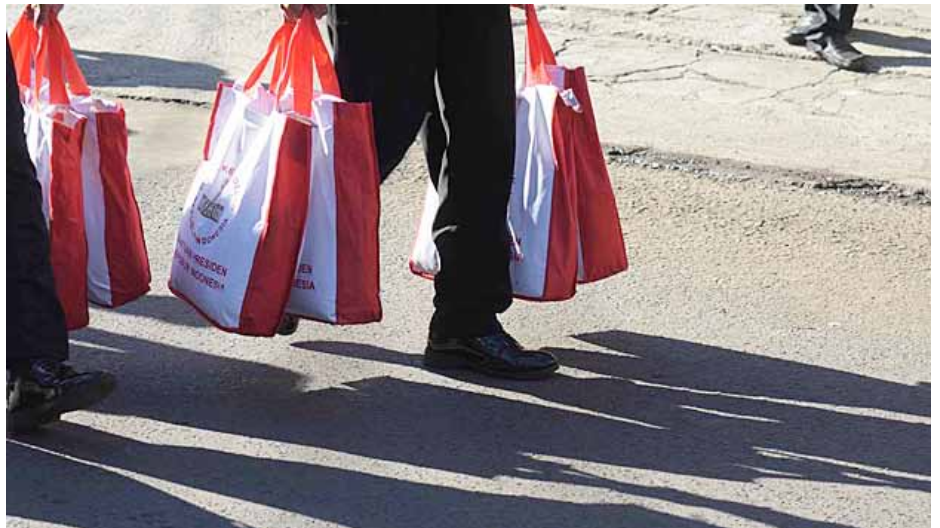
Ilustrasi Bansos jelang Pilkada Serentak 2024.

Anggota Dewan Perwakilan Daerah (DPD) RI dari Kalimantan Tengah Agustin Teras Narang, mengkritik penyaluran bantuan sosial (bansos) yang cenderung dimanfaatkan untuk kepentingan politik dalam kontestasi Pilkada Serentak 2024.