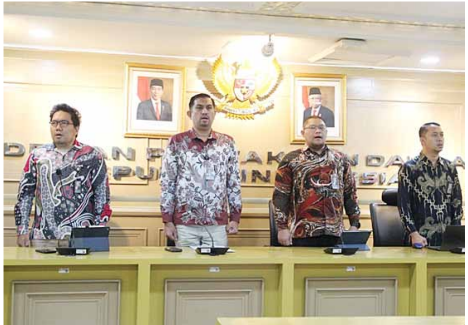
Suasana pembukaan Forum Konsultasi Publik (FKP) Sekretariat Jenderal Dewan Perwakilan Daerah Republik Indonesia (Setjen DPD RI) melalui Bagian Pengelolaan Sistem Informasi (BPSI).

Sekretariat Jenderal Dewan Perwakilan Daerah Republik Indonesia (Setjen DPD RI) melalui Bagian Pengelolaan Sistem Informasi (BPSI) menggelar Forum Konsultasi Publik (FKP) tentang standar pelayanan konektivitas jaringan intranet dan internet pada Jumat (13/9/2024). Kegiatan ini bertujuan untuk meningkatkan pengelolaan layanan Teknologi Informasi (IT) di lingkungan Setjen DPD RI.