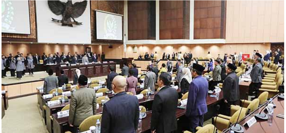
Suasana Sidang Paripurna Luas Biasa DPD RI untuk mengesahkan Pertimbangan RAPBN TA 2025 di Gedung Nusantara V, Komplek Parlemen, Senayan, Jakarta.

Dewan Perwakilan Daerah (DPD) RI berhasil mengesahkan Pertimbangan DPD RI atas Rancangan Undang-Undang tentang Anggaran Pendapatan dan Belanja Negara (RAPBN) Tahun Anggaran 2025.