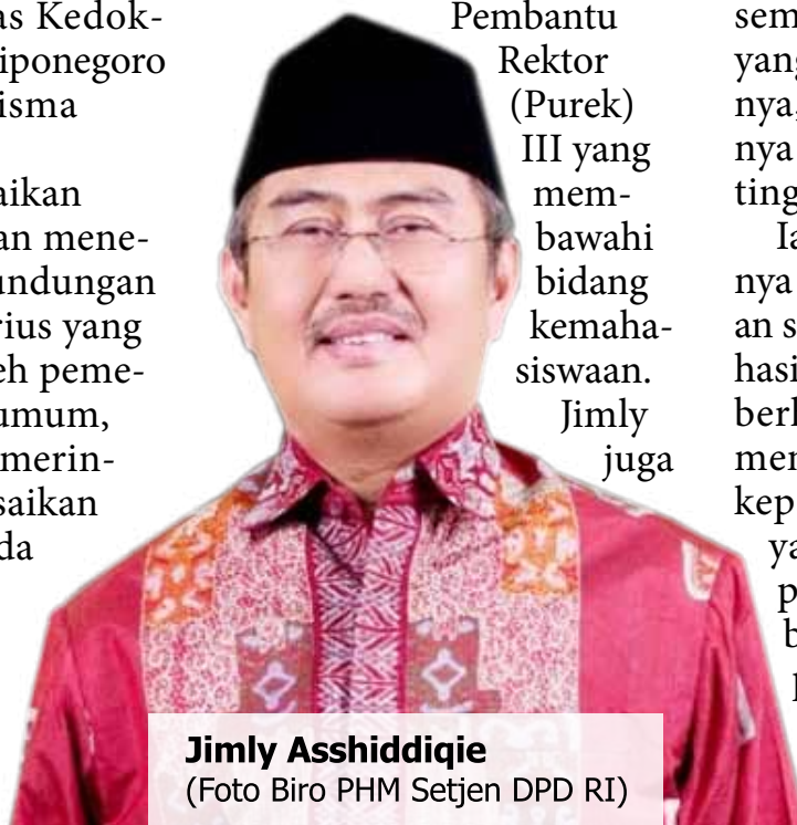
Jimly Asshiddiqie

Ia juga menyoroti pentingnya pencegahan perundungan sejak masa orientasi mahasiswa baru (ospek) dan berharap pemerintah memberikan sanksi tegas kepada perguruan tinggi yang lalai mengatasi kasus perundungan. Kasus bunuh diri dokter Risma pada Senin, 12 Agustus 2024, kembali menyorot masalah ini di kalangan masyarakat.(*)