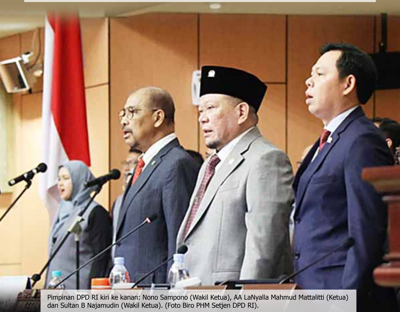
Pimpinan DPD RI kiri ke kanan: Nono Sampono (Wakil Ketua), AA LaNyalla Mahmud Mattalitti (Ketua) dan Sultan B Najamudin (Wakil Ketua).

Sesuai Pasal 91 Tata Tertib DPD RI, pemilihan pimpinan dilakukan dengan sistem paket yang mencerminkan keterwakilan sub wilayah dan keterwakilan perempuan dari empat sub wilayah yang ada. (*)