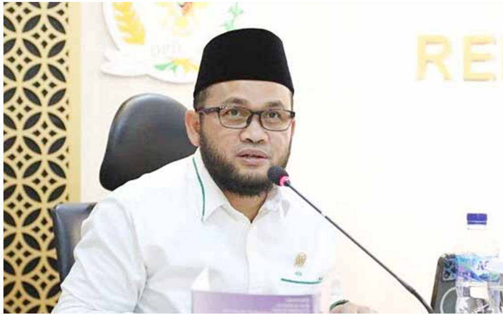
Anggota DPD RI Dedi Iskandar Batubara

Anggota Dewan Perwakilan Daerah (DPD) RI dari pemilihan Sumatera Utara (Sumut) Dedi Iskandar Batubara mengingatkan para penyelenggara negara untuk bersikap netral pada pemilihan kepala daerah (pilkada) serentak yang akan dilaksanakan pada tanggal 27 November 2024 mendatang.