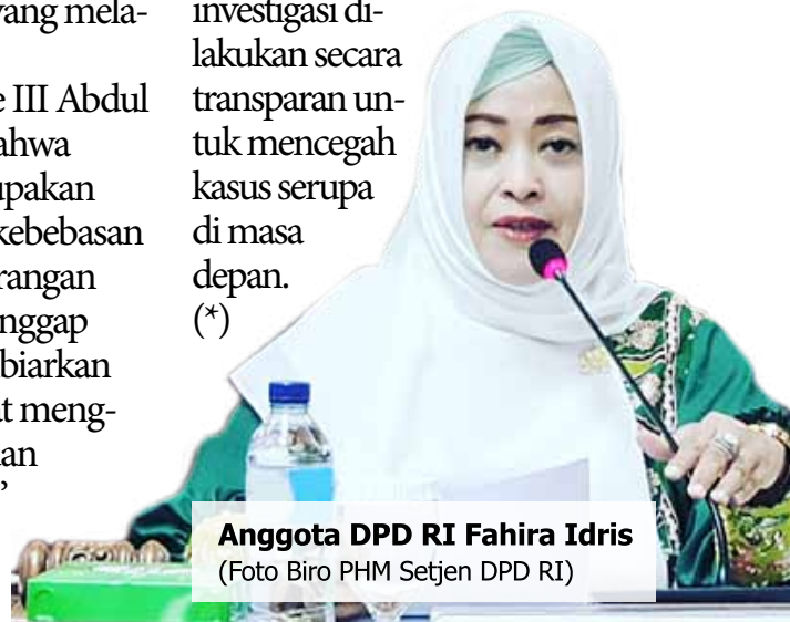
Anggota DPD RI Fahira Idris